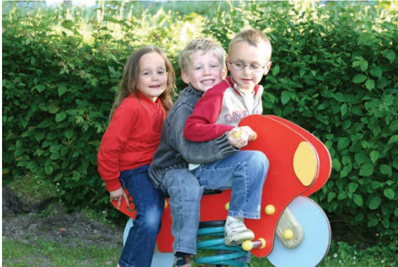
Pour le bonheur des enfants : nouveau jeu derrière la Mairie