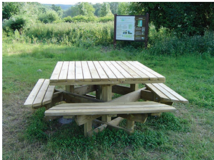
Sur le quai de Seine : la nouvelle table de pique-nique