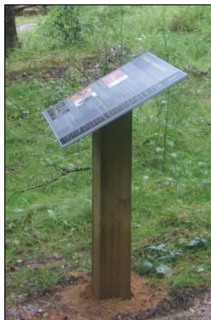
Un totem d'accueil et six tables de lectures inclinées, en accès libre toute l'année

Tout ce travail a été rendu possible grâce aux importantes recherches menées par les archéologues depuis 10 ans, tant sur le terrain en été, que dans les bureaux et dans les archives en hiver. C'est également le recoupement des hypothèses formulées par les archéologues pour Saint Thomas d'Aizier avec les observations réalisées sur d'autres sites en Europe qui a permis la conception des panneaux du sentier d'interprétation.