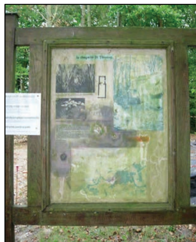
L'ancien panneau posé en 1987

Les visiteurs (dont le nombre est estimé entre 4 et 5000 par an) disposeront donc enfin des clefs de compréhension du site et de ses vestiges.