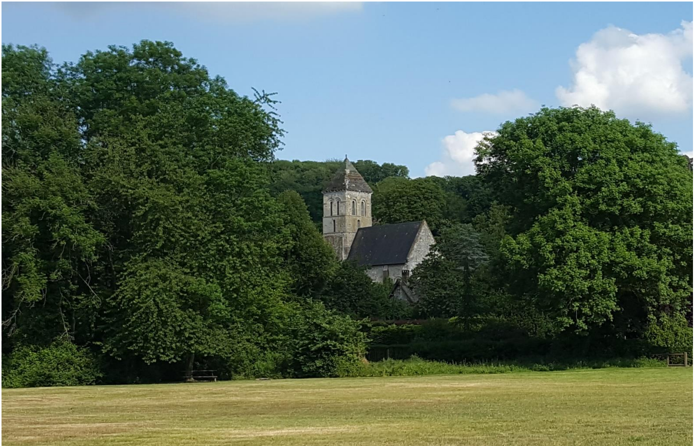
Eglise Saint-Pierre d'Aizier, lauréat du Coup de Cœur Agnès Vermersch 2020.