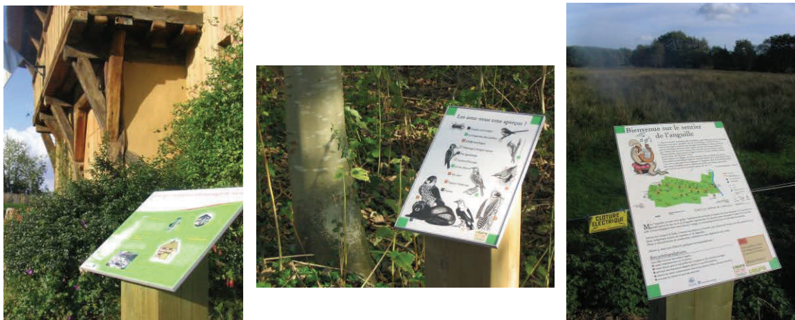
Le sentier de Saint Sulpice de Grimbouville (réalisation Conseil Général de l'Eure)

L'aménagement de la chapelle Saint-Thomas va être amélioré par la mise en place d'ici l'été prochain d'un sentier d'interprétation. Son aspect devrait se rapprocher du sentier de découverte du marais de Saint Sulpice de Grimbouville.