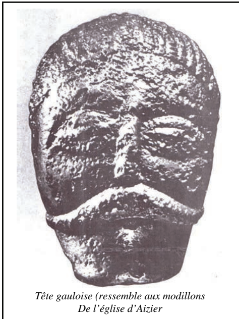
Tête gauloise (ressemble aux modillons De l'église d'Aizier

ls étaient arrivés par le fleuve qui n'avait pas encore de nom. Les marécages qui bordaient une forêt épaisse, leur avaient semblé propices à leur installation : ils auraient le poisson, le gibier et le bois pour la construction des maisons et le chauffage ; De ces hommes, il nous reste peu de choses : leur savoir et leurs coutumes se transmettaient oralement, leurs objets usuels et leurs habitations étaient en bois. Cependant, grâce à quelques stèles funéraires et certains écrits d'auteurs latins, plus de 1000 mots nous ont été transmis.