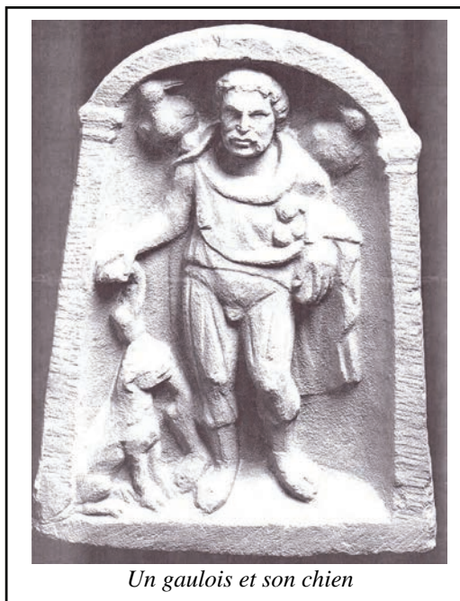
Un gaulois et son chien

Ils pratiquent la médecine par les plantes, ils savent que la centaurée (exacon) est purgative et que le séneçon ( samolos) est calmant. Leur