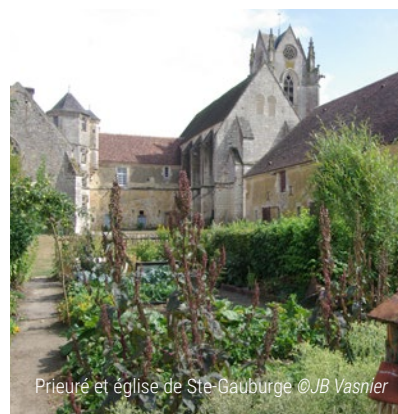
Prieuré et église de Ste-Gauburge

Infos : accès libre toute l'année www.normandie-tourisme.fr