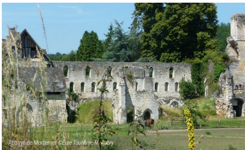
Abbaye de Mortemer