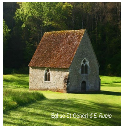
Église St-Cénéri