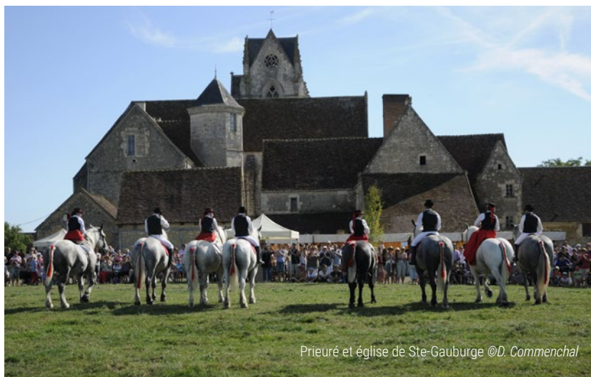
Prieuré et église de Ste-Gauburge