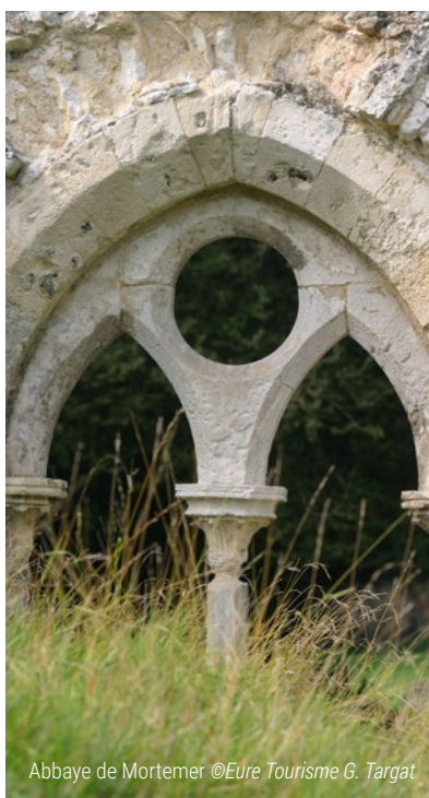
Abbaye de Mortemer