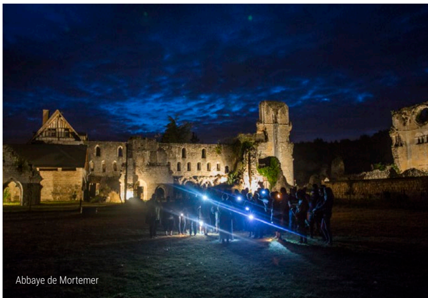
Abbaye de Mortemer

Infos : accès libre toute l'année www.eure-tourisme.fr