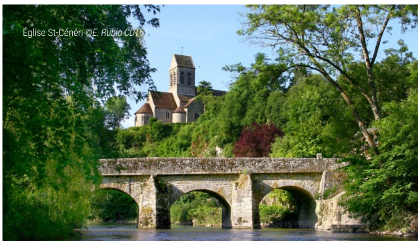
Église St-Cénéri