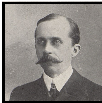
Louis Brindeau. Député de la Seine-Inférieure de 1895 à 1912. Sénateur de la Seine-Inférieure de 1912 à 1936.

Très coûteux, les projets n'eurent pas de suite.