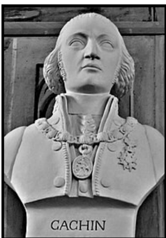
Buste de Joseph Cachin dans la salle des Illustres de l'abbaye-école de Sorèze

Par la suite, un canal de 70 km de long sur 40 mètres de large passant par Vieux-Port, Aizier les prairies de Vatteville, aurait traversé la Seine pour aboutir rive droite à Villequier.